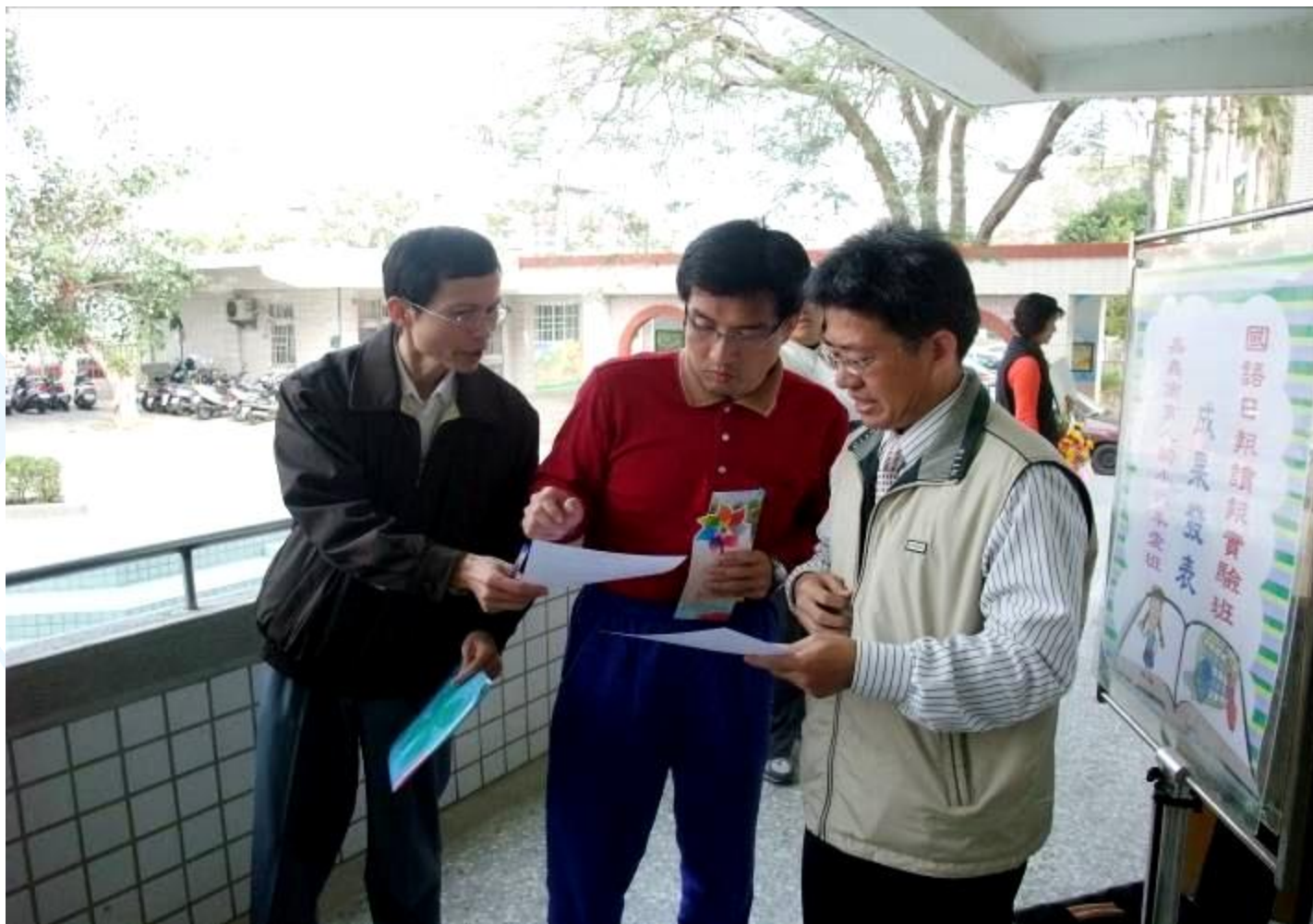
教育處副處長 課長 校長來參觀