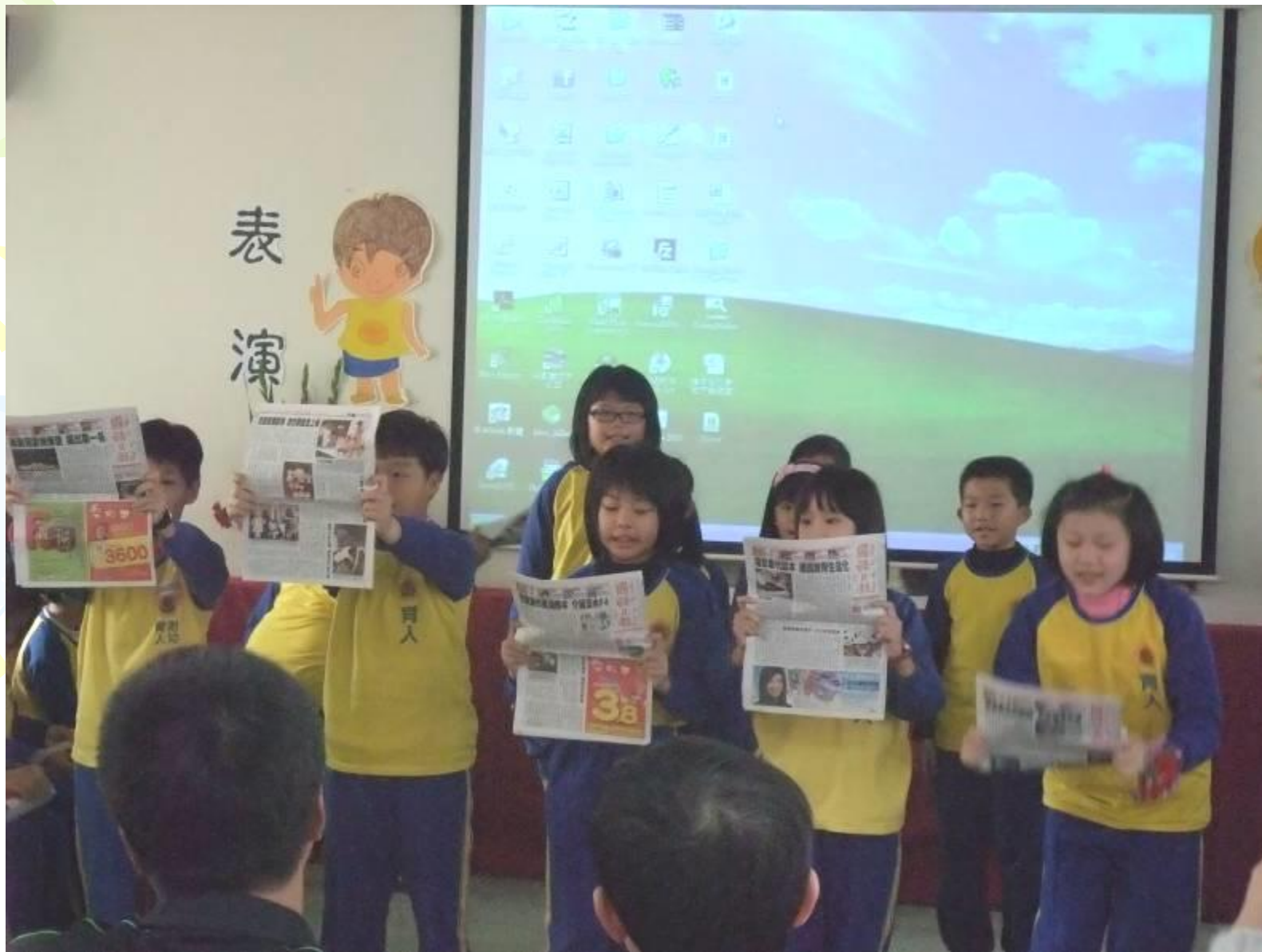
眾人面前展現自信